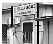
Il comando vigili

CAPODRISE (ren.cas.) - Circa 50 contravvenzioni per abbandono di rifiuti elevate dopo l'entrata in vigore del sistema di videosorveglianza, soprattutto nelle zone periferiche del paese. Questi i dati diffusi dal Comune guidato da Angelo Crescente a margine dell'installazione delle 29 videocamere sul territorio. Da una quindicina di giorni il Municipio ha attivato i rilevatori di targhe, grazie ai quali stanno partendo i primi inviti a presentarsi per i veicoli sprovvisti di copertura assicurativa e