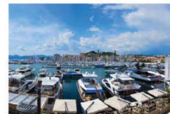
Aree portuali o lidi balneari