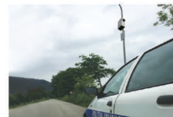
Aree periferiche del territorio