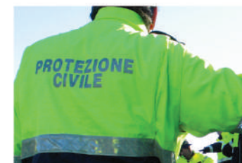
Supporto protezione civile